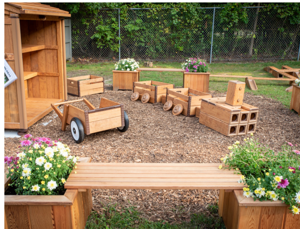
Área de construcción del patio trasero

Creo que desempeñarme como directiva de la Biblioteca Pública de Longwood (Longwood Public Library, LPL) es, entre todos los trabajos de voluntariado que he realizado y sin lugar a dudas, mi preferido. La LPL es considerada no solo el corazón literario de Longwood, sino también un lugar de suma importancia. Es un verdadero honor desempeñar un rol en el desarrollo y el fortalecimiento de nuestro mayor recurso cultural. Estoy muy orgullosa de sus instalaciones, programas y profesionales que laboran en la LPL y eternamente agradecida por el apoyo constante que he recibido de nuestra maravillosa comunidad. En caso de ser reelegida, continuaré asumiendo este compromiso financiero con toda seriedad en mi tercer período como directiva de la LPL. ¡Gracias, Longwood!