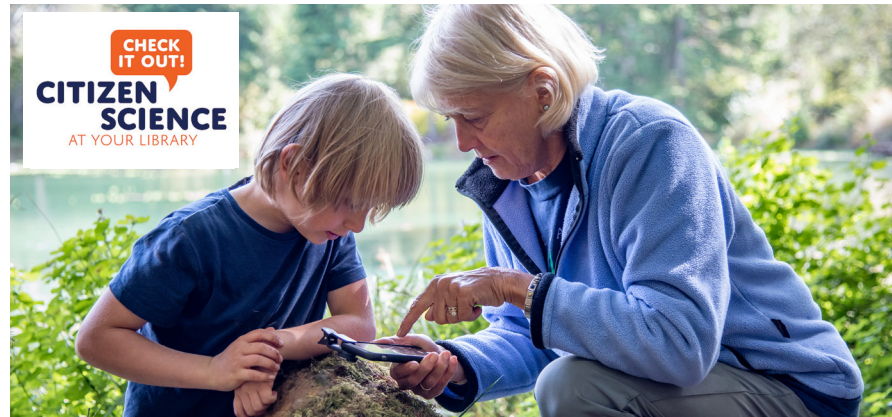
Kits de ciencia ciudadana