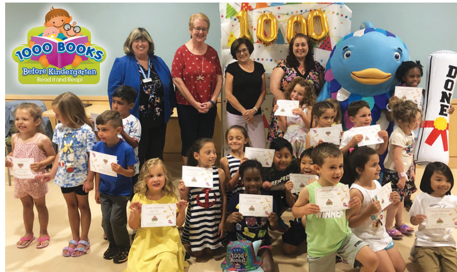
Celebración multianual de 1000 libros antes del jardín de infancia