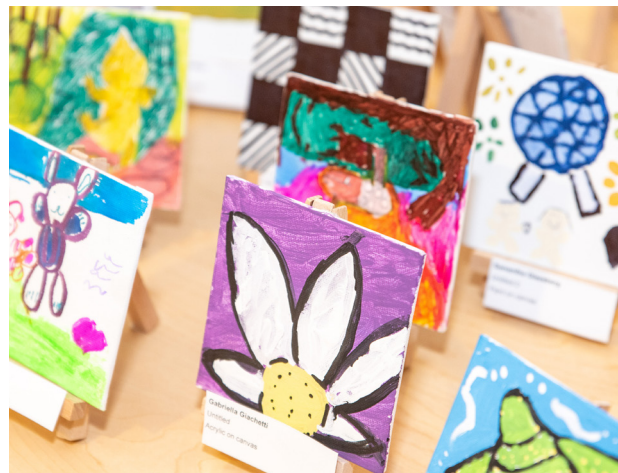
Gran espectáculo de arte diminuto de septiembre